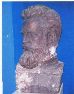
В. Цветков "Христо Ботев"