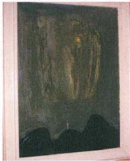
В. Ганецовски "Околчица"