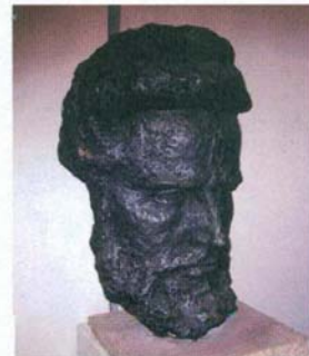
И. Фунев "Маска на Ботев"