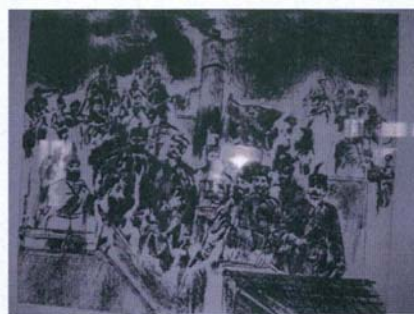
П. Ненов "На кораба "Радецки"