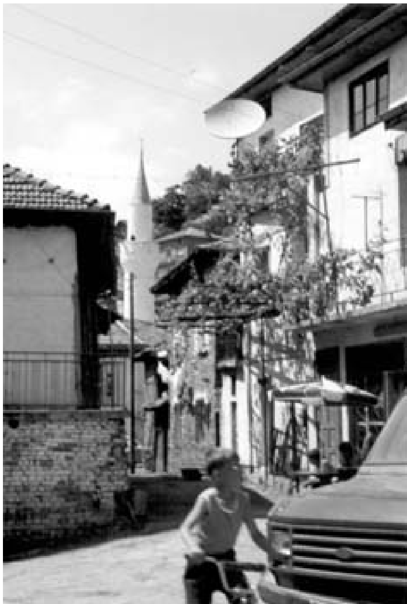
Село Горно Дряново днес

нагоре синовете са свободни да се отделят окончателно от бащиния си дом... Най-първа грижа у възрастния младеж е да спечели пари и си съгради нова къща. За съграждане на къщата си той не трябва да очаква от никого помощ. Единственото нещо, което бащата е длъжен да стори, е да даде даром потребното място за новата къща... Ако синът до 30-годишната си възраст не е могъл да съгради отделна къща, а пък е дошло време да се жени, баща му отстъпва временно една-две стаи от старата къща,