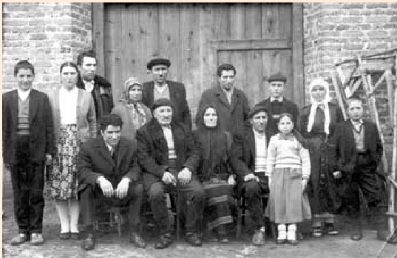
Муратовият род, Якоруда, 1964 г.

Къщите на отделните семејства оформят организацијата на частното пространство на общноста. Хората ги строят, за да живеат в тях и отглеждат децата си. Но тоа не е “квца – крепост”, а е “дом – имот”. Прво, защото е отворен за всички роднини и соседи /комшулуци, седенки, взаимопомощ в трудовите дейности/ по всяко