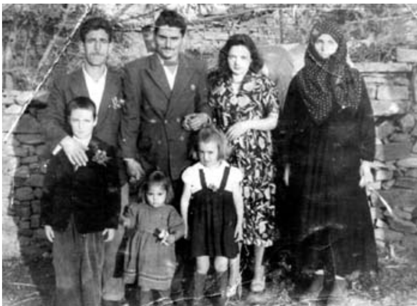
Отново заедно - гости от Турция

За традицията на общността може да се каже, че в нейната основа е властта на рода, която утвърждава социалния ред чрез раждането на деца. В селската патриархална общност действат определени механизми, чрез които се поддържа социалния ред в нея. “С йерархичните нива на традиционното общество са свързани характерни роли и образи. Това е общество, в което кръвната връзка е основният структурообразуващ фактор. В него семейството в системата на рода бележи рамките на един примитивен социален ред с независима вътрешна организираност... със собствена затворена стопанска система, свързана изключи-