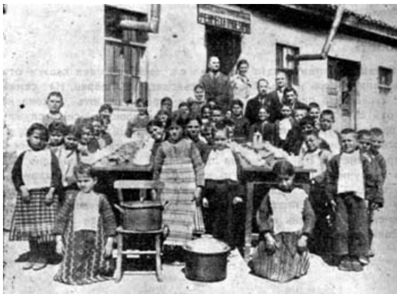
Трапезария в с. Михайлово, Сливенско

Натовареността на учителките, свързана с тяхната организационна, благотворителна и просветна дейност като учителки-съветнички включва: провеждане на анкети за храната, облеклото, навиците и хигиената на учениците; посещения на техните домове; въвеждане на карти за тяхното развитие; събиране на средства и организиране на трапезарии, които да действат в учебните месеци; разработване на училищна градина с помощта на учениците за допълнителни продукти за трапезарията; изнасяне на беседи пред майките; организиране и контролиране с децата на училищната хигиена; оборудване на училищна аптечка и библиотека; подготовка на театрални представления и вечеринки с благотворителна и просветна цел; организиране на Ден на детето, на седенки, на детски игрища; учредяване на дружества на СЗДБ с възрастните, на дружества на Младежкия червен кръст и въздържателни дружества с децата; редовен контакт с лекаря и местната власт. От СЗДБ учителките-съветнички получават карти за развитието на децата и литература, както и списанието "Нашето дете".