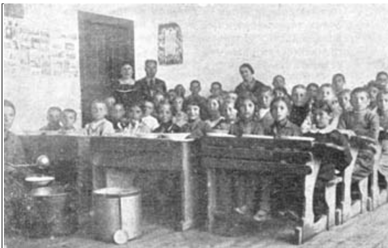
Селска трапезария във Варненско

низиращи. Около половината от учителките-съветнички успяват да открият трапезарии. Обикновено те започват без никаква традиция, в условия на скептицизъм и недоверие и това, че успяват в продължение на месеци да поддържат намиране на средства, готвене и раздаване на храна на децата всеки ден, е огромен личен успех за всяка една от тях. Всяка една от тях намира средства от най-разнообразни източници: благотворителни представления с децата, томболи, продажба на мартеници, лазаруване, коледуване, от църковни фондове, продукти на децата, забави, частни дарения, дарения от царското семейство, помощи от общината или от Съюза за закрила на децата и т. н. Отчетите на учителките-съветнички дават сбита представа за дейността им в тези години: