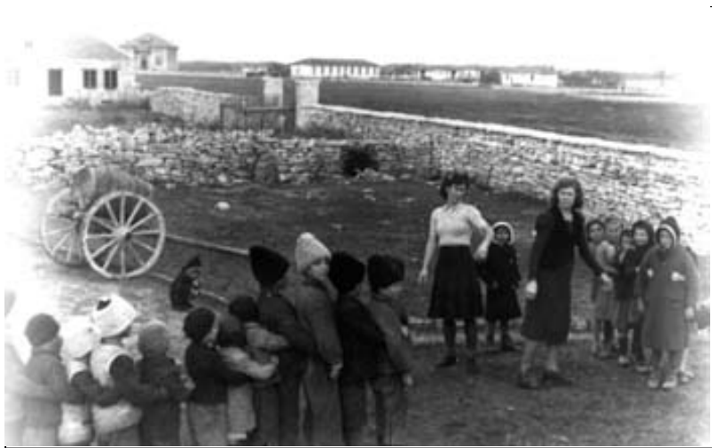
18. 2. 1934 г. Хиблий 40

Разширяването на обществената благотворителност за деца към селото има голям отзвук и в чужбина. Българският опит се смята за изключително интересен с изнамерените форми за създаване на организационна мрежа, която обхваща и селата. Международният съюз за закрила на децата представя ръководството за учителки-съветнички в своите издания, за да може да се ползват неговите основни положения и в други страни.