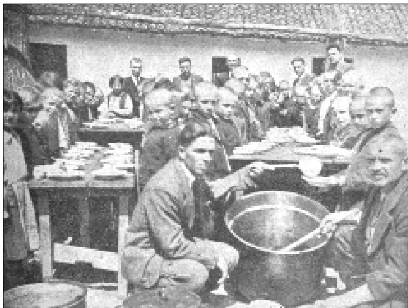
Безплатна ученическа трапезария в село Белоптичене, Белоградчишко

та-съветничка. Успеете ли да намерите средства за трапезария, успеете ли да заинтересувате селяните, това значи, че сте спечелили тяхното доверие, първата придобивка, към която трябва да се стремите и без която не бихте могли да постигнете нищо на село." 9