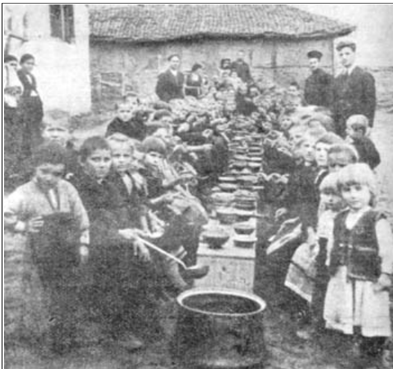
Трапезария в с. Кесебирци, Ихтиманска околия