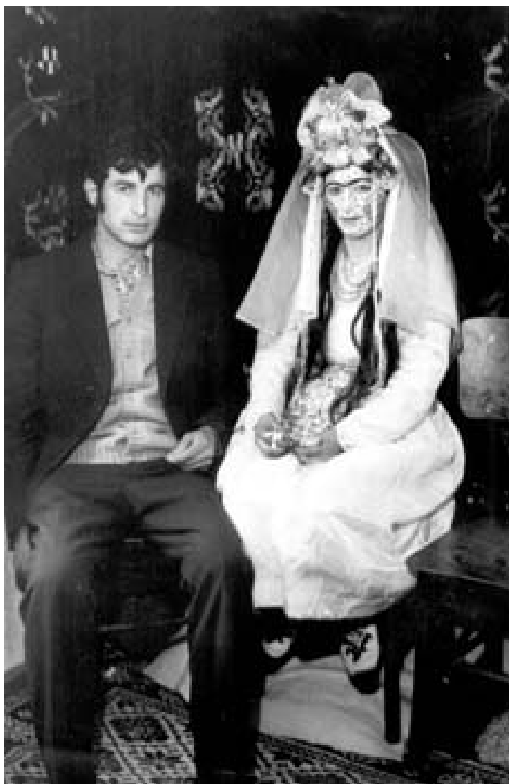
Младоженци от Якоруда, 70-те години на XX век