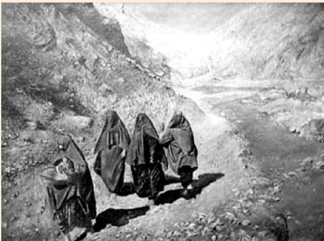
Картината “Помакини” на Н. Тахтунов, 1926 г.

В османското общество през XVI до началото на XX век преобладаващият вид е разширеното семейство, което на свой ред се вписва в по-широката социална единица, каквато е родът. Според османските данъчни регистри, семейството се нарича хане /домакинство/ и се състои средно от пет души. Но това домакинство не съвпада с простото нуклеарно семейство. Почесто домакинства, които спадат към три различни поколения на едно и също семейство живеят в обща социално-икономическа единица, разположени около общ вътрешен двор. Разширеното семейство