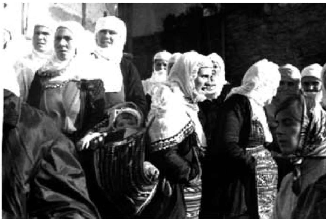
Жени от село Рибново, 1999 г.

/Стоилкова, А., З. Иванова, Свещеният коран през вековете – каталог на изложба от ръкописи и печатни издания, съхранявани в НБКМ, С., 1995/