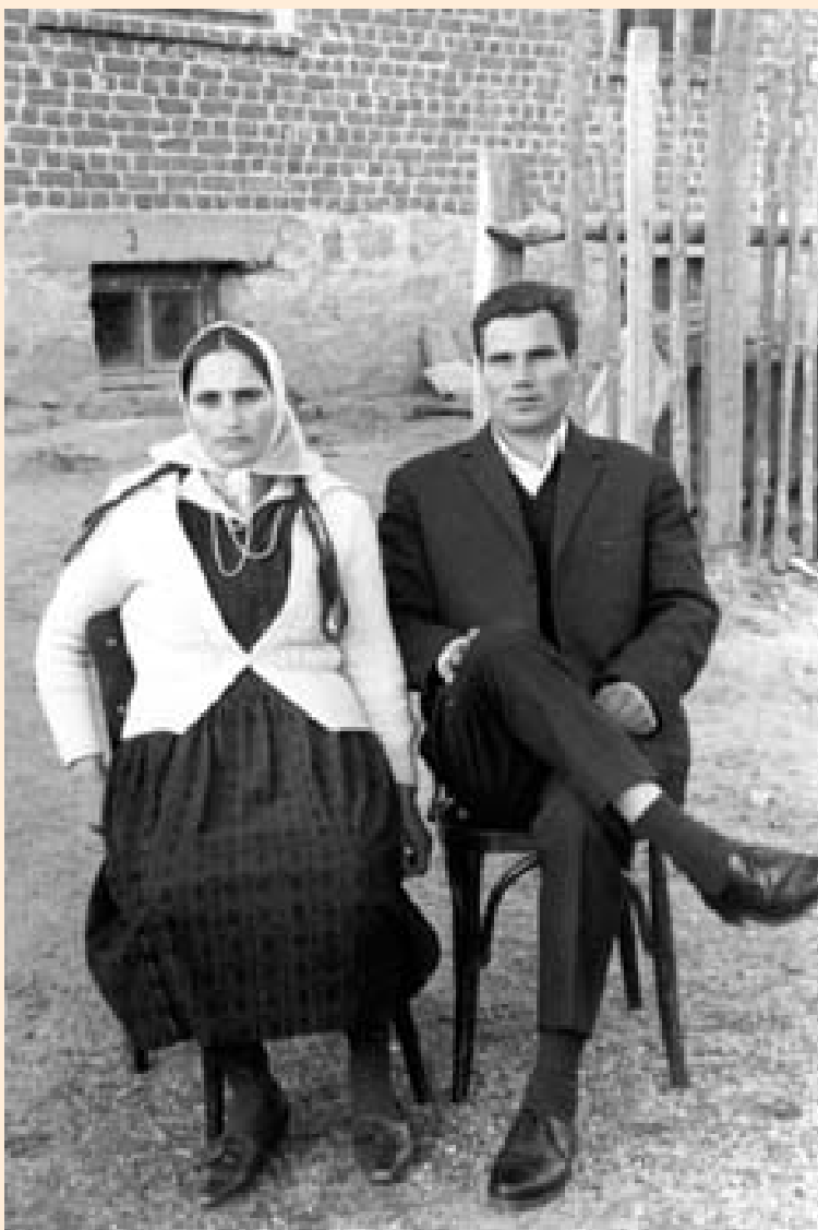
Семејство от Якоруда, 60-те години на XX век

В Корана има няколко Сури, в които са представени различни аспекти на изгонването на Адам и Ева от Рая. В тях е зададен божественият модел на отношението мъж – жена. Те не са просто мъж и жена /т.е. - същества с различен пол/, а те са съпрузи, т.е. вече са свързани в брачен съюз. Затова бракът е и канонична ценност. Ислямът признава жената за равен партньор на мъжа в запазването на живота чрез децата, които ще родят. Същевременно бракът е и свещен, тъй като чрез него се поддържа връзка и хармония не само между съпрузите, но и между тях и Аллах. В Суриите е заложена част от една система от нравствени норми, които регламентират отношенията между мъжа и жената. Общото в тях е присъствието на Аллах като централна фигура - той ги сътворява, той ги прави съпрузи, той им казва да раждат човеци, но само с неговото знание и съгласие. Божественото послание носи ясна ценностна система – йерархия в отношенията – хора и Бог; мъж – жена; в брака и отношенията на съпружество.