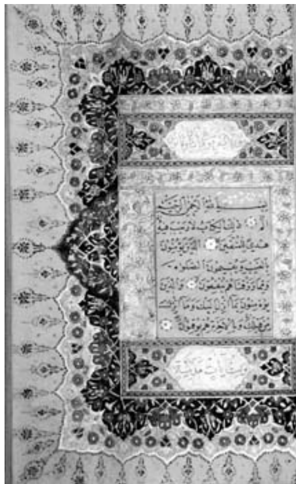
Препис на Корана от 19 век