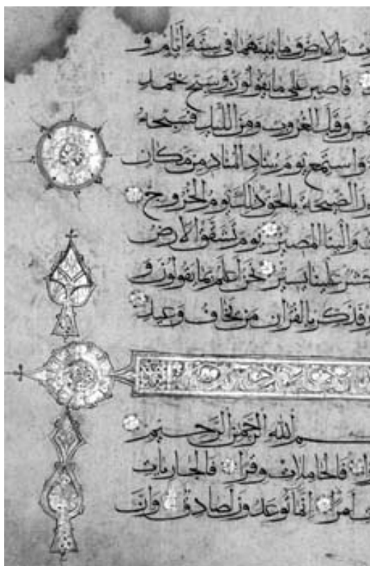
Препис на Корана от 16 век

Като се разделите по групи разгледайте внимателно снимките на преписите на Корана, които са запазени