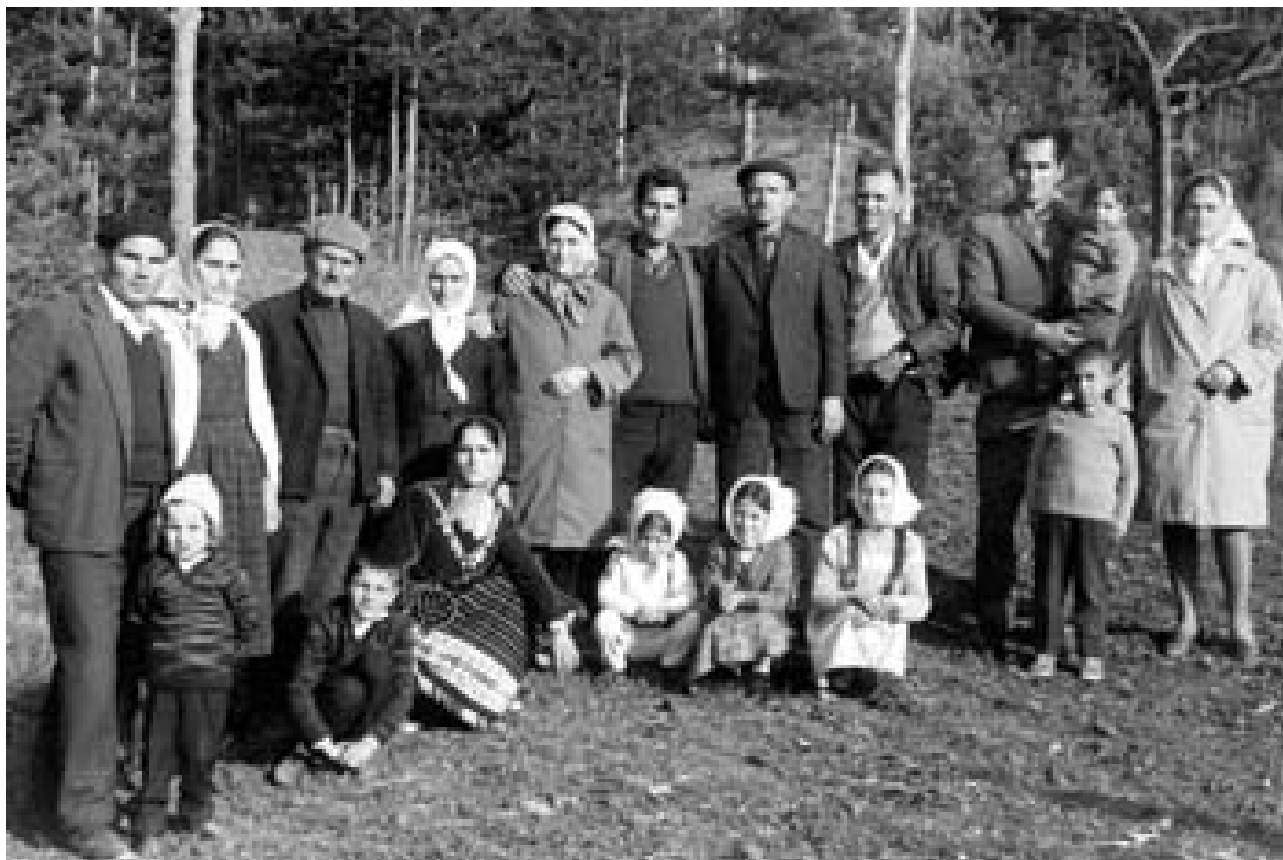
Якорудско, 60-те години на XX век

тера на обобщения, в тях много рядко се срещат отделни случки, по-скоро се очертава нормативната страна на всекидневие то. Заедно с това в спомените за детството на най-възрастното поколение много рядко се говори за наказания или бой - това са отделни случки по поводи най-често на взаимоотношения между самите деца: според разказите родителите /както майките, така и бащите/ наказват децата си само в изключителни случаи.