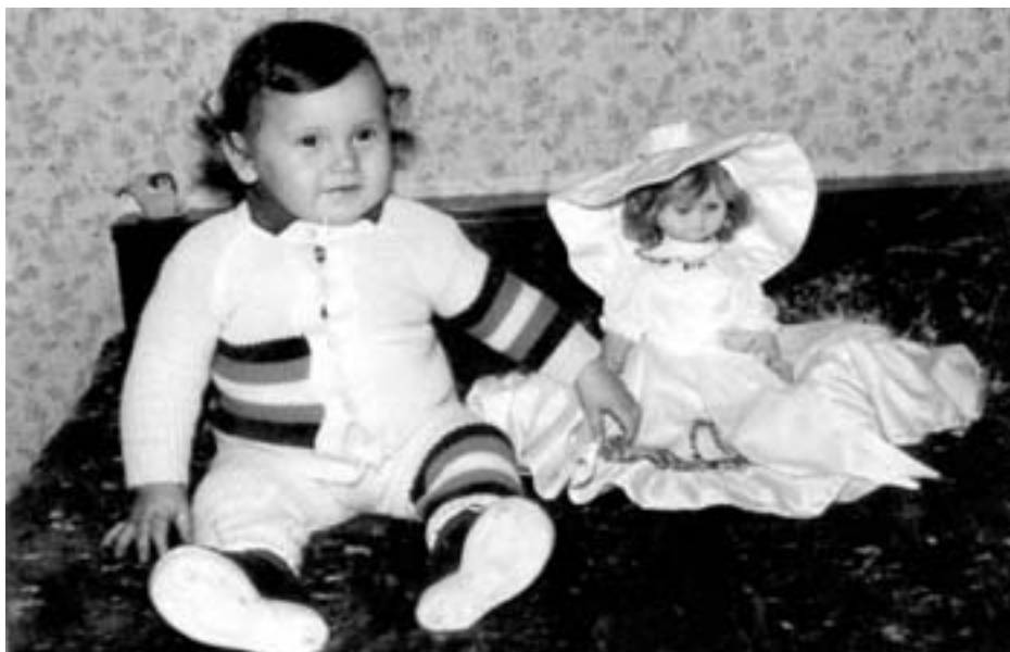
Дебрен, 90-те години на XX век

Ако най-възрастните почти не говорят за игри извън труда в своите спомени, поколението на 40-45 годишните /особено жените/ си спомня по-сложни в сравнение с миналото игри със сюжети: не с кукли и други играчки, но игри на “продавачки в магазин” и други, заимствани от града или резултат на динамизиращия се живот в селото. Играчките се появяват в разказите на родените в края на 60-те години, но тогава те са били рядък и ценен подарък и са били пазени изключително грижливо. Развлечени-