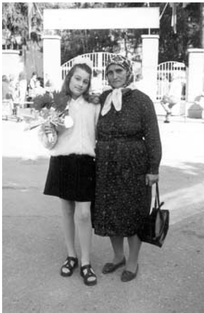
Баба и внучка, Якоруда

· Знаете ли какви опасности за здравето на жената се създават в такава ситуация?