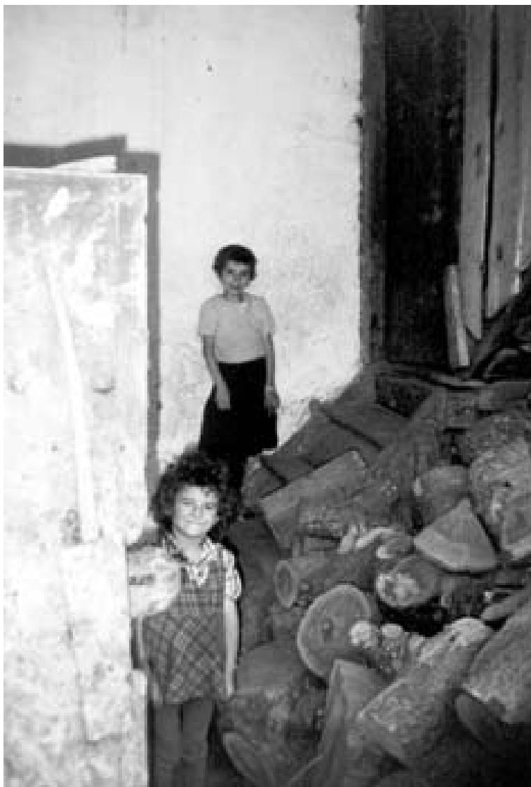
Труд в семейството, Дебрен, 90-те години на XX век

налото са свързани с работата. Детският спомен е неотделим от оране, копане, от работата с домашните животни. Семейната икономика - изхранването на семейството, е била немислима без участието на децата и от двата пола. Детското всекидневие в тези десетилетия между двете световни войни е белязано преди всичко от спомени за участие в селския труд, в който на децата в семейството обикновено са били отреждани и тежки самостоятелни отговорности.