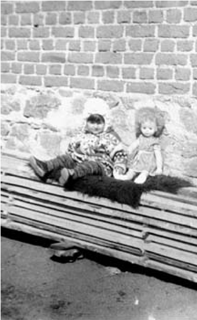
Детска игра, Якоруда