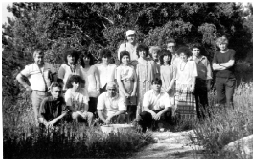
Обмяна на опит в Силистра, юни 1996 г.