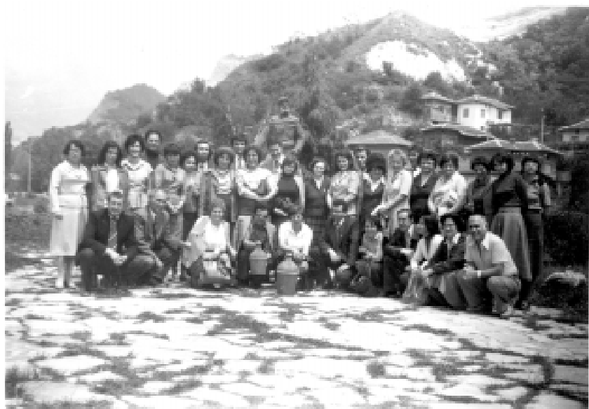
Регионално съвещание на архивите: Благоевград, Кюстендил, Перник, Михайловград, Враца, Видни, Ловеч, Плевен, Габрово, Пловдив, Пазарджик, Смолян. 22 май 1981 г. Посещение в град Мелник.