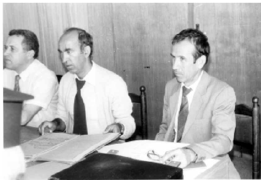
Конференция по случай 30-годишнината на ОДА- Благоевград. Юни 1982 г.