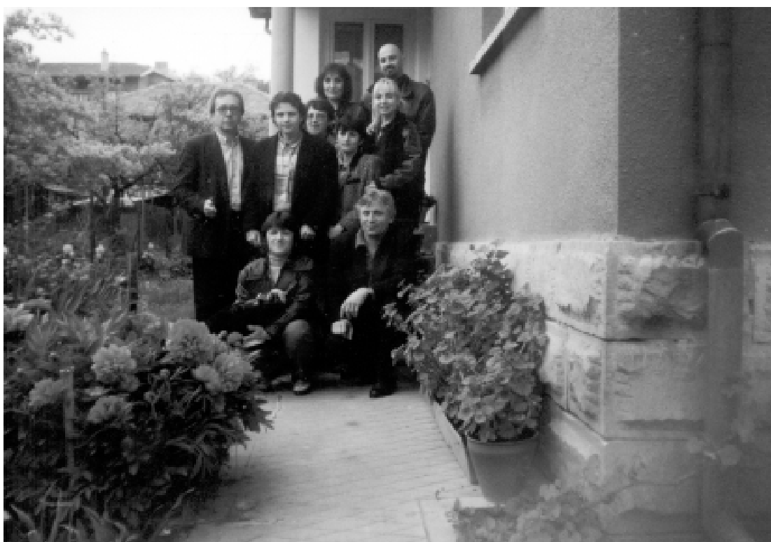
На екскурзия в Елена, май 1998 г.