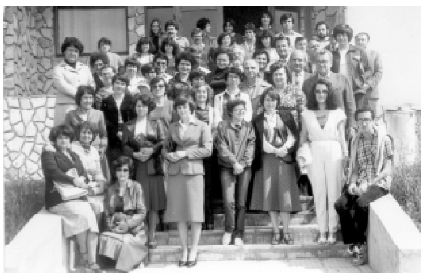
Районно съвещание. “Цигов чарк”, 1983 г.