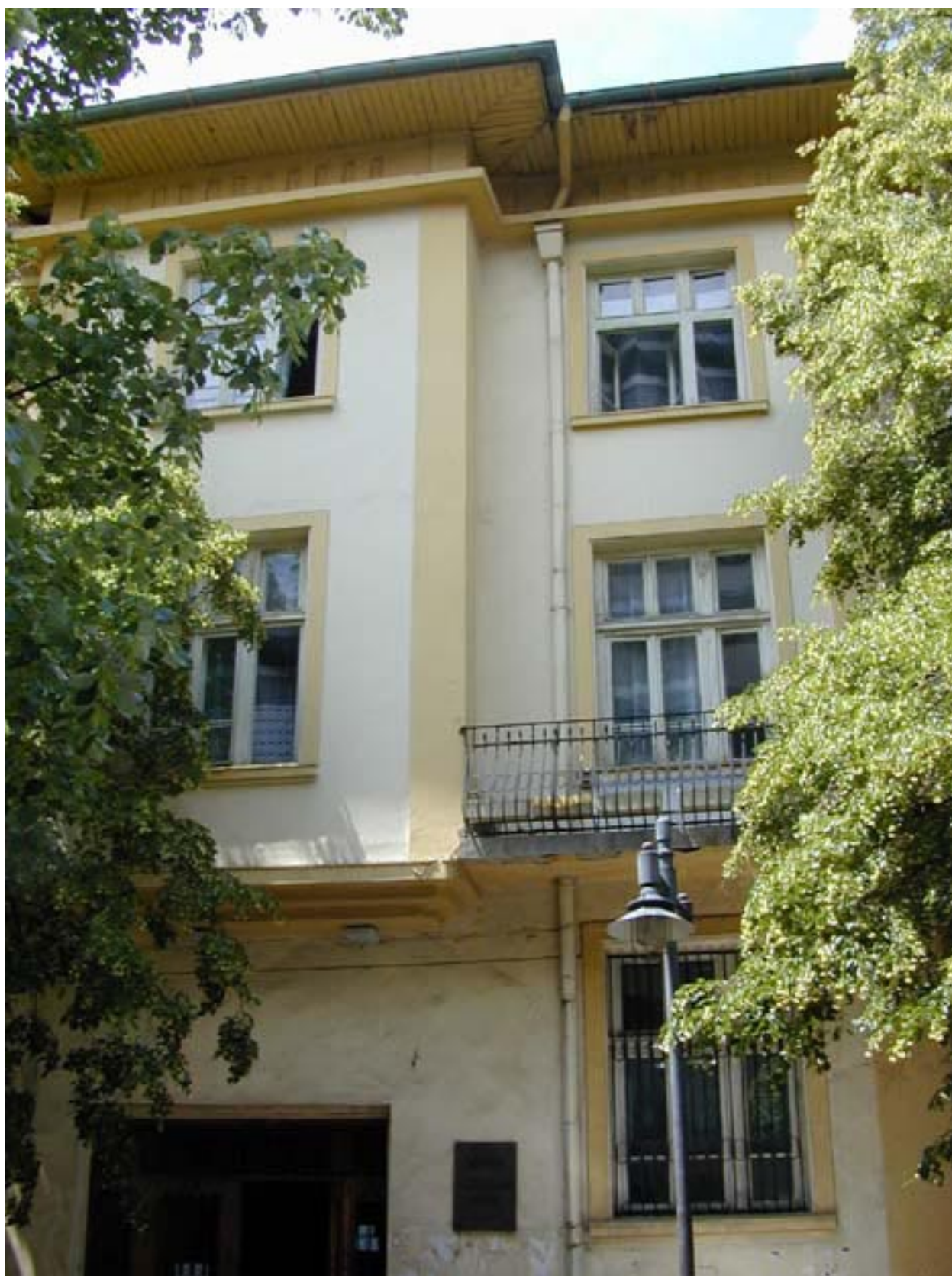
Административната сграда на Държавен архив-Благоевград след 1989 г.