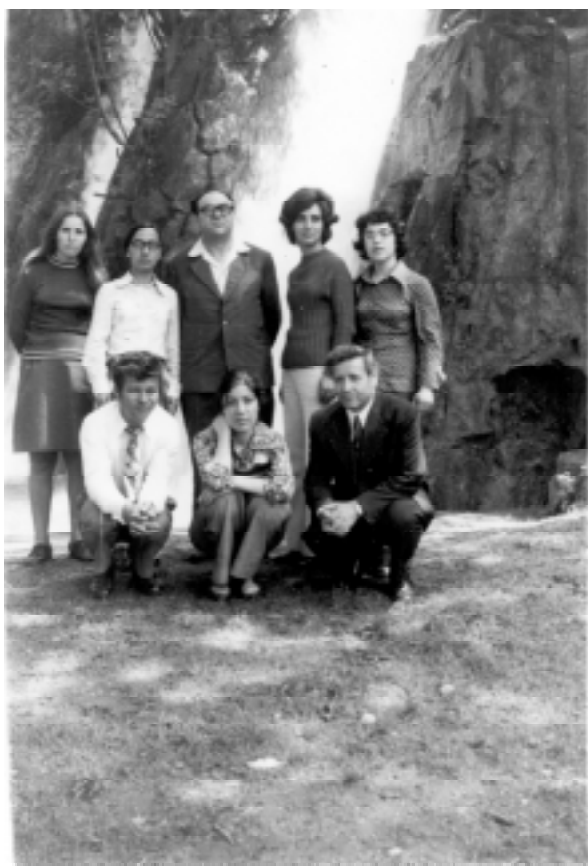
На Бачковския манастир, 1975 г.