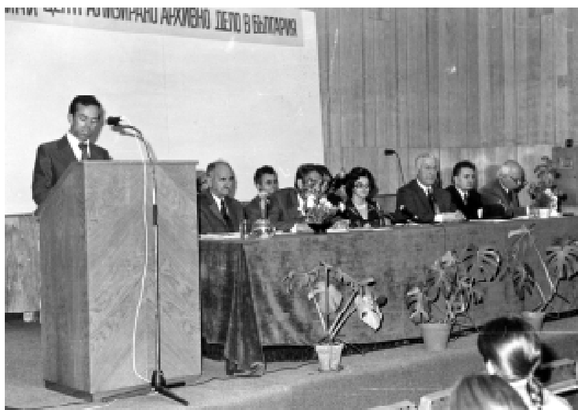
Конференция по случай 25-годишнината на централизираното архивно дело в България. Благоевград. 1976 г.