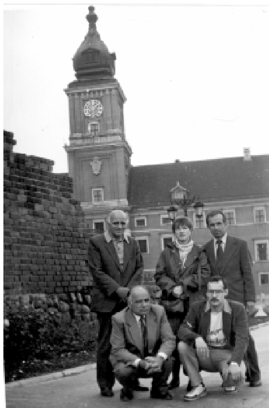
Българска делегация на посещение в полските архиви. Варшава, юни 1988 г.