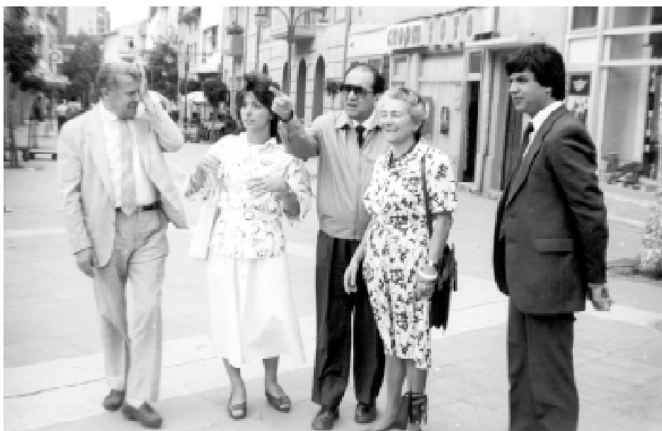
Директорът на италианските архиви г-н Гриспо (в средата) на посещение в Благоевград