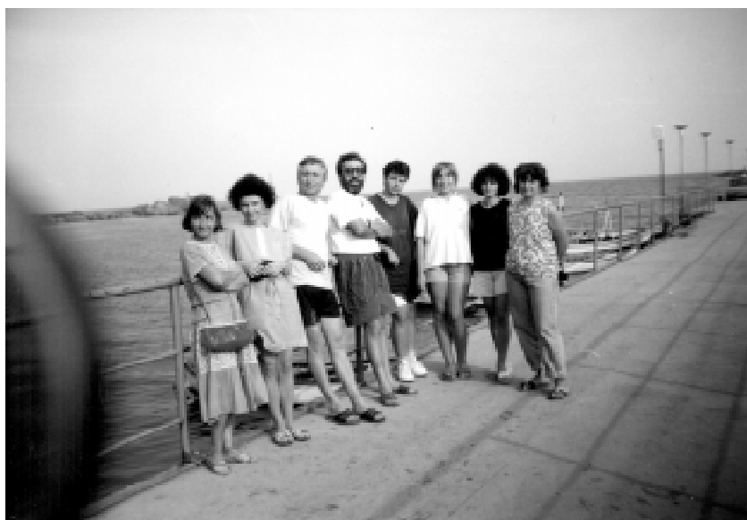
На екскурзия в Ахтопол, септ. 1994 г.