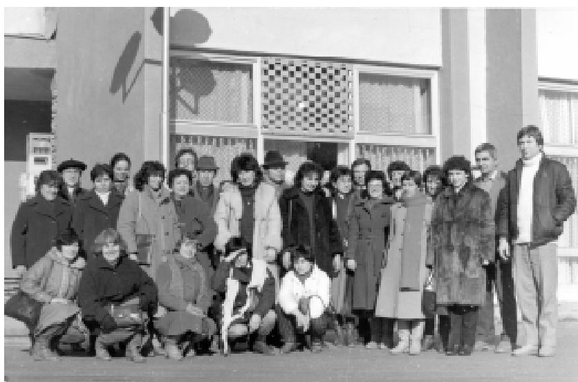
С колектива на ДА- Пазарджик. Белица, февр. 1988 г.