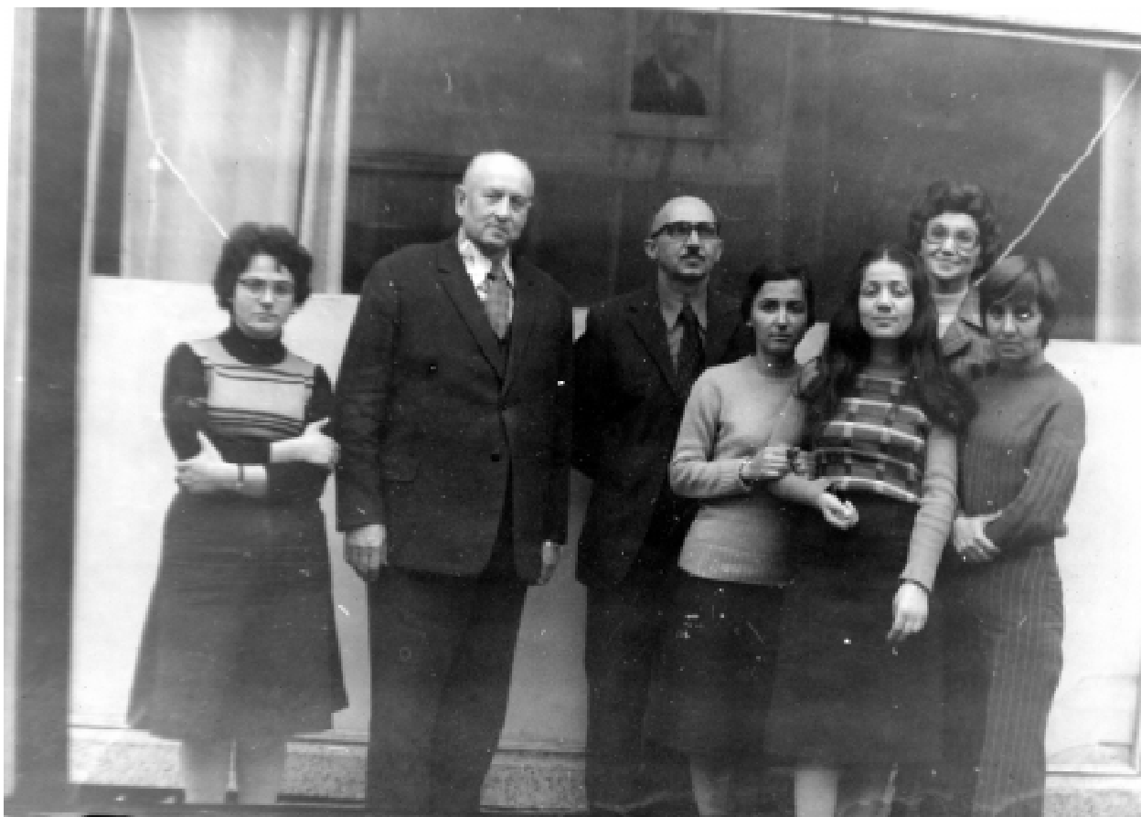
С първия директор на архива в Благоевград (третият от ляво), 1976 г.