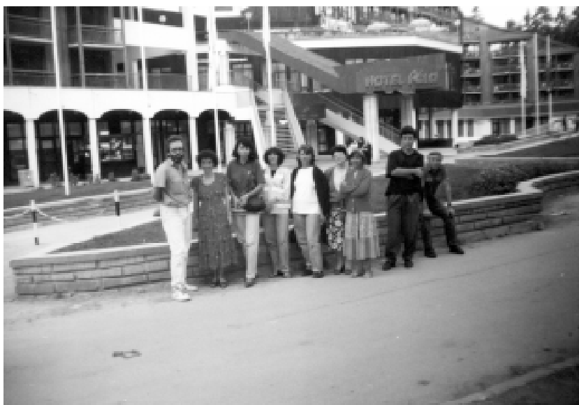
На Боровец, окт. 1994 г.