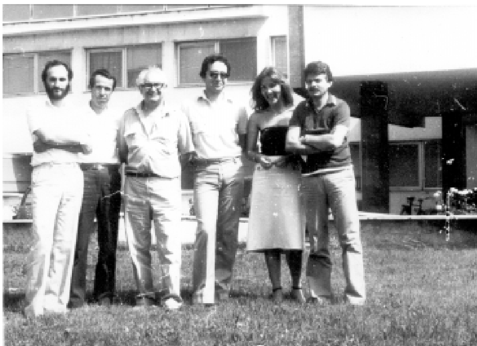
На посещение в архива на НР Македония. Скопие, 30 юни 1981 г.