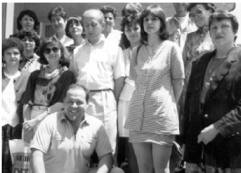
Курсът от следдипломната специализация по архивистика в СУ "Климент Охридски" с участието на двама служители от ДА-Благоевград. София, 1995 г.