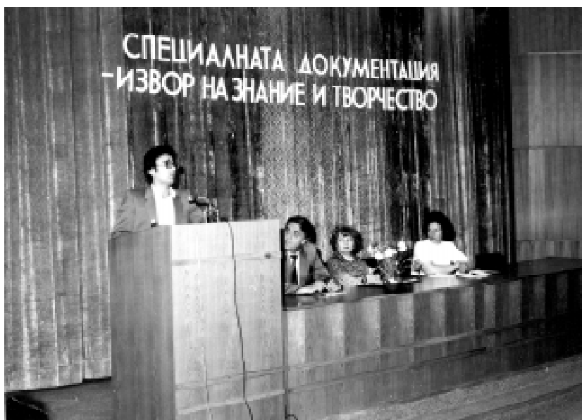
Районно съвещание за специалните видове документи. Ловеч. 8 юни 1982 г.