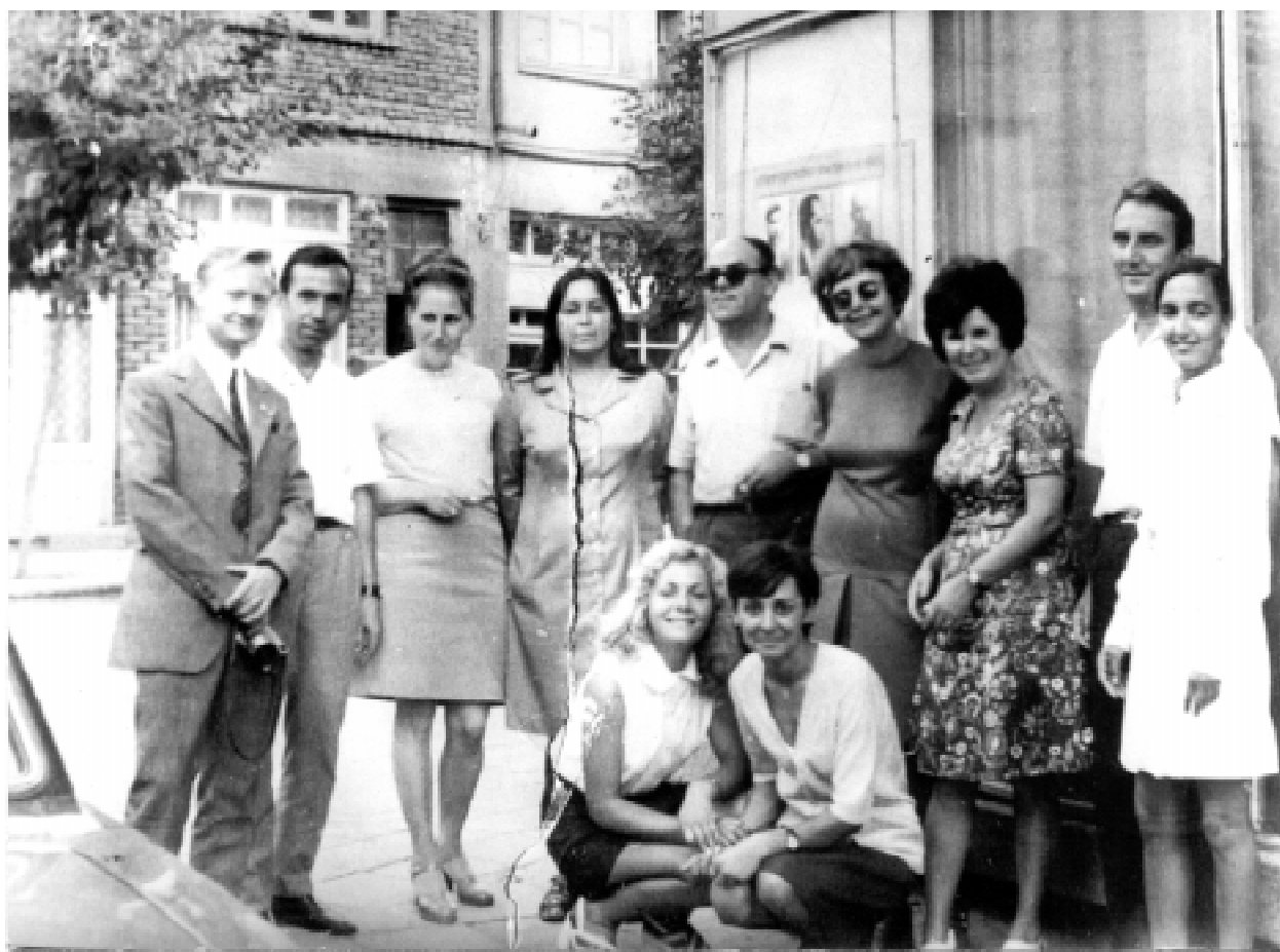
Гости от ГДР и от Архивното управление-София. Благоевград, 1973 г.