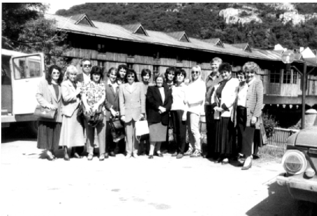
Ловеч, май 1998 г.