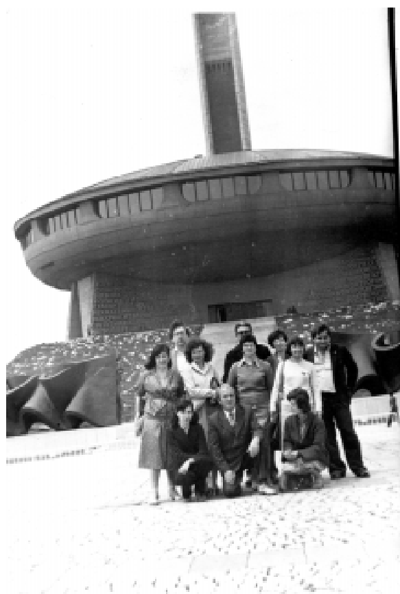
С колеги от архива в Стара Загора на връх Бузлуджа. Май 1982 г.