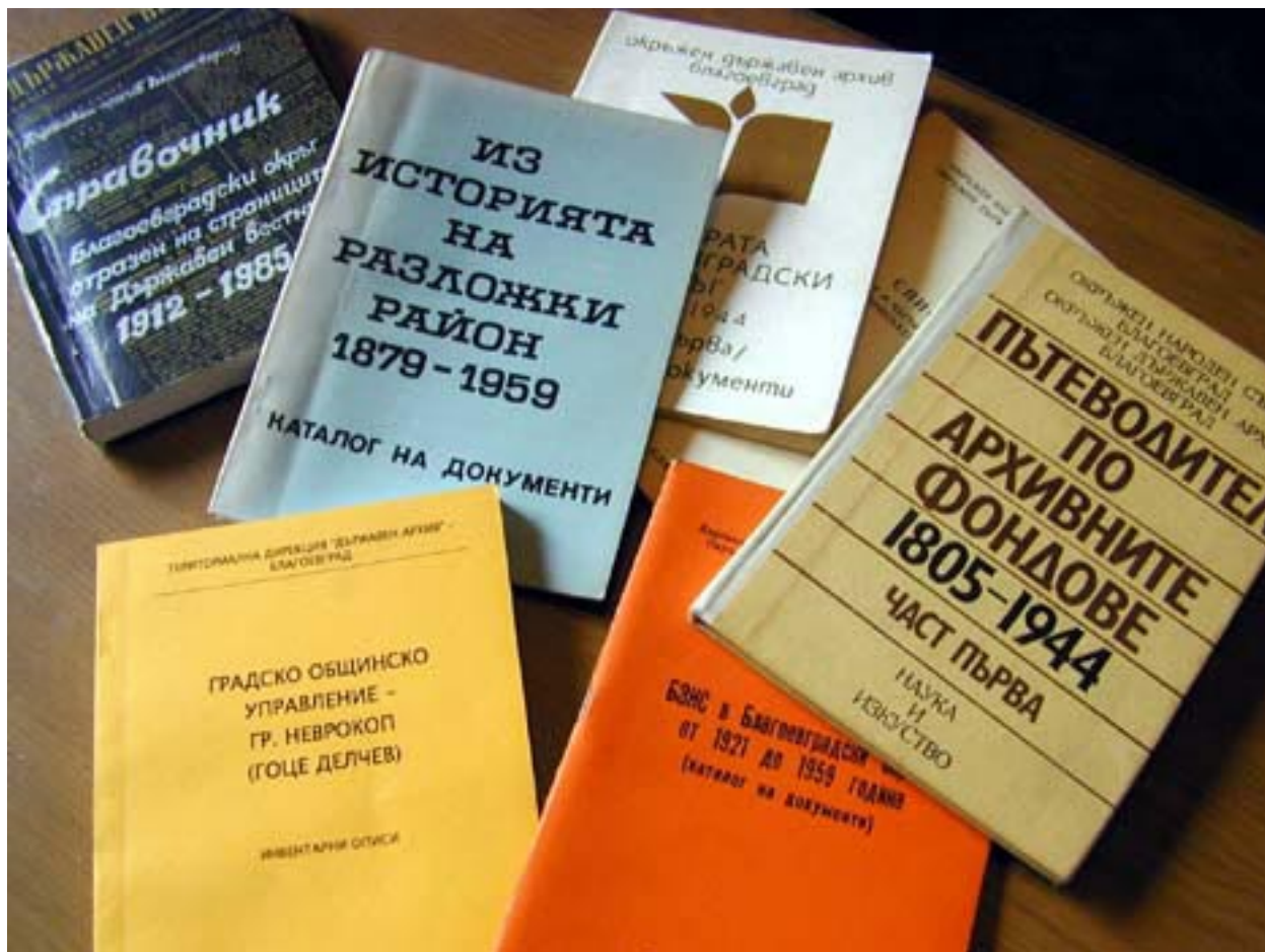
Печатни справочници на ДА-Благоевград

късно, тези комплекси са три. Първият комплекс се отнася за периода от 1803 г. до края на 1944 г. Той включва 374 архивни фонда с близо 12 000 архивни единици. Вторият комплекс е на създадените от дейността на учрежденията след 1944 г. документи. Той има 1509 фонда и над 130 000 архивни единици. Третият комплекс се формира през 1994 г. Той включва предадените от Общинския съвет на БСП в Благоевград документи на бившия Окръжен партиен архив - Благоевград. Масивът съ-