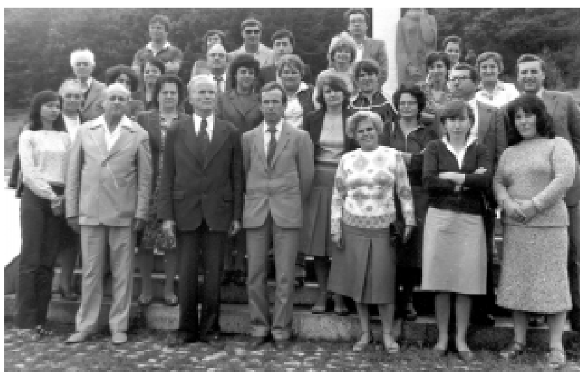
Научно-практическа конференция. Благоевград, септ. 1984 г. Посещение в с. Добринище.