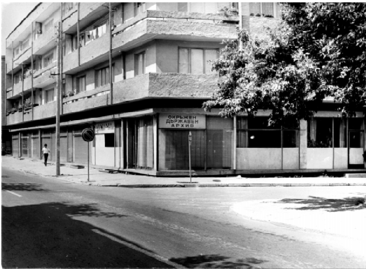
Партерният етаж на Държавен архив-Благоевград от 1968 г.

На 10 окт. 1951 г. Президиумът на Народното събрание приема Указ № 515 за създаване на Държавен архивен фонд /ДАФ/ на Народна Република България. С него се утвърждава моделът за организацията на архивното дело в страната. Определя се съставът на ДАФ, редът за работа с документите, сроковете за тяхното съхранение. Изпълнението на указа се възлага на Министерството на вътрешните работи /МВР/. Шест месеца по-късно, на 18 апр. 1952 г. правителството приема Постановление № 344 “За организиране на ДАФ и одобряване правилник на архивното управление при МВР”. Актът разпорежда във ведомството на МВР да се създаде Архивно управление със задача да организира и да ръководи архивните учреждения. Създават се Централен държавен архив на НРБ, Централен държавен истори-