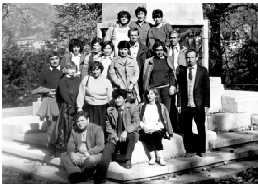
С колеги от ДА-Силистра, Благоевград, 23 окт. 1986 г.