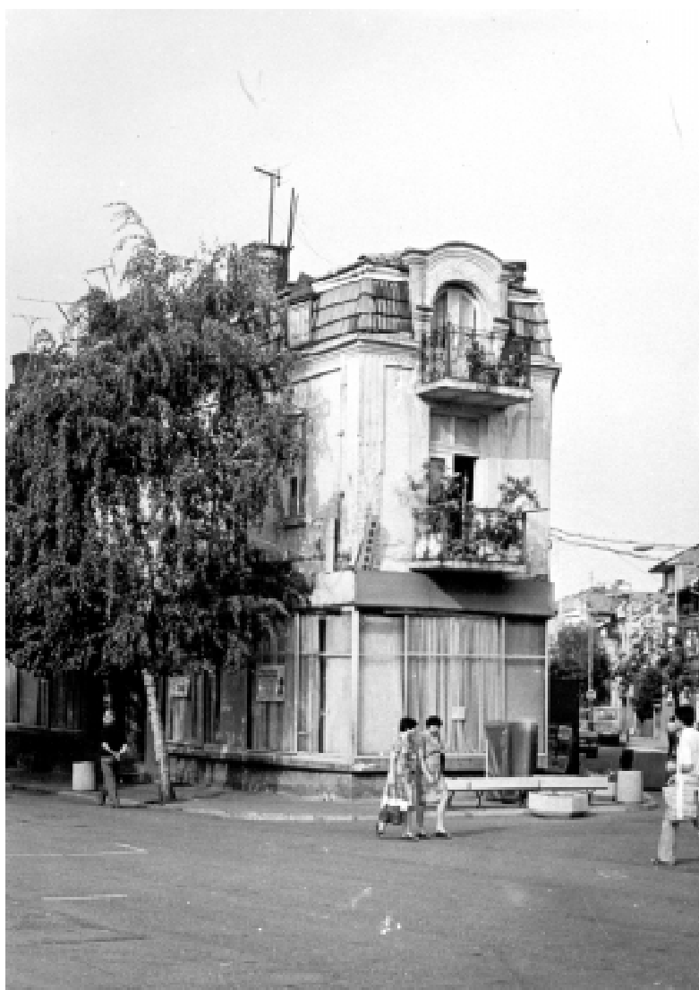
Сградата на Държавен архив-Благоевград, 1953 г.

Архивното дело е специализиран отрасъл от управлението на съвременните държави. Чрез него се осъществява издирване, съхранение и предоставяне за използване на архивни документи, които са създадени предимно в резултат от дейността на държавни учреждения, на политически партии, на дружества, на изтъкнати личности и обществени организации. Още в края на 18 век архивното дело получава широк обществен интерес в редица европейски страни. Приемат се специални закони, по силата на които се създават публични архивни учреждения и съхраняваните в тях документи стават достъпни за всички граждани. У нас архивното дело като политика на държавата за събиране, за опа-