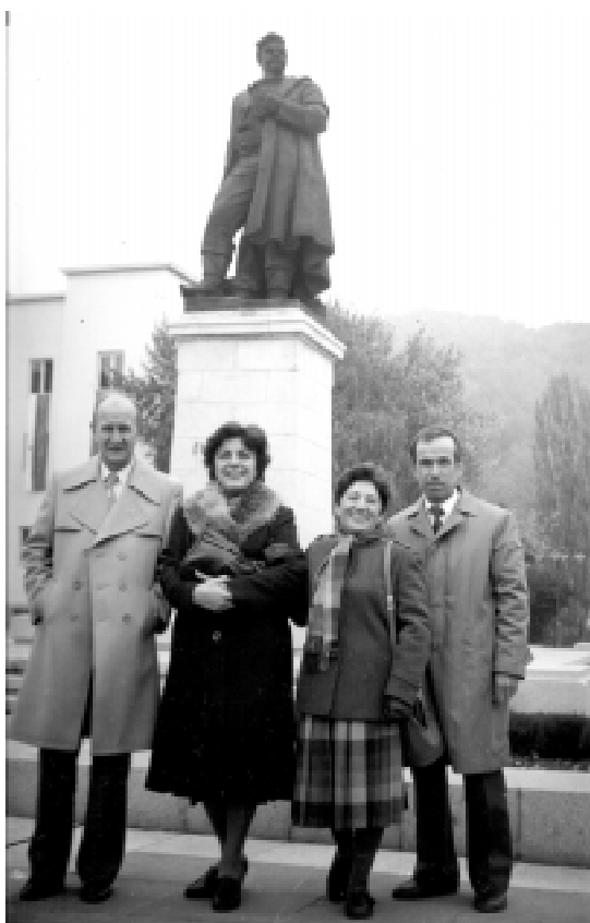
Гости от Югославия. Благовград, 7 ноември 1987 г.