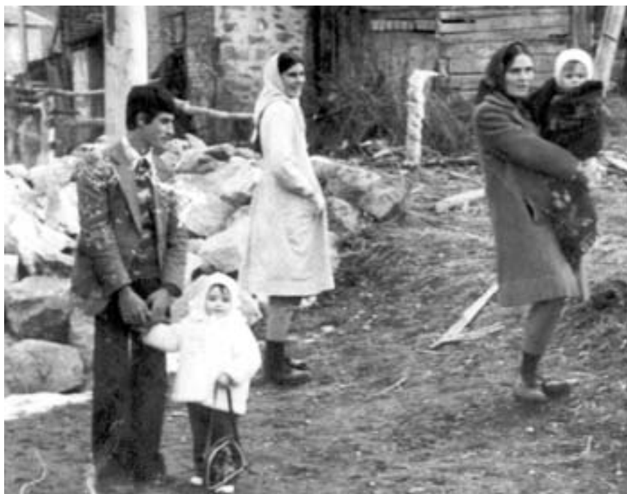
На двора, Якоруда, 1976 г.

Особено значение за родителите има смъртта на децата. Казва се, че починалото дете е застъпник в Съдния ден и води родителите си в рая. В литературата има затрог-