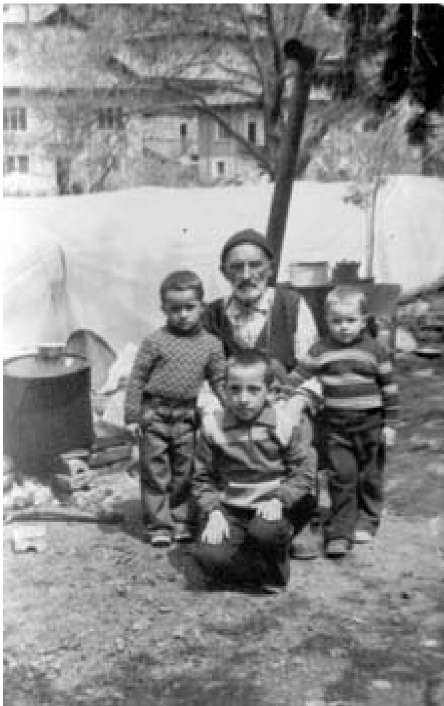
Дядо и внуци, с. Буково

Раждането на дъщеря в тези староарабски общества се приема като несполука за мъжа. Отвращението към дъщерите е могло да доведе до напускане на жената и детето или дори до умъртвяване на детето -