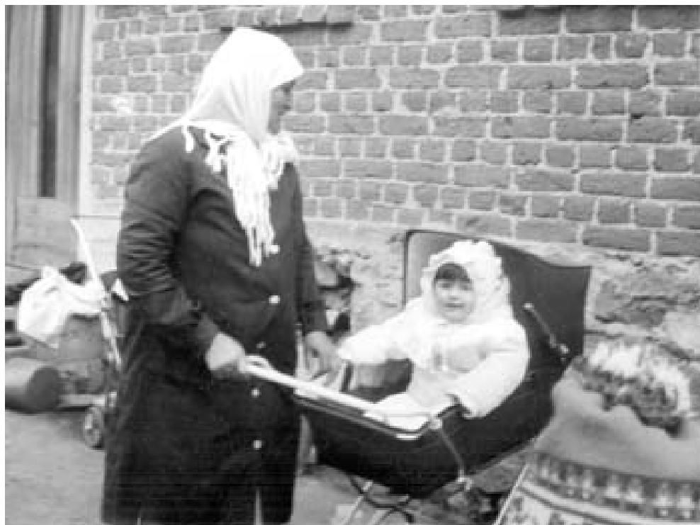
Якоруда, 80-те години на XX век

Разпределете се в групи и дискутирайте по следните проблеми, а след това проведете общо обсъждане: