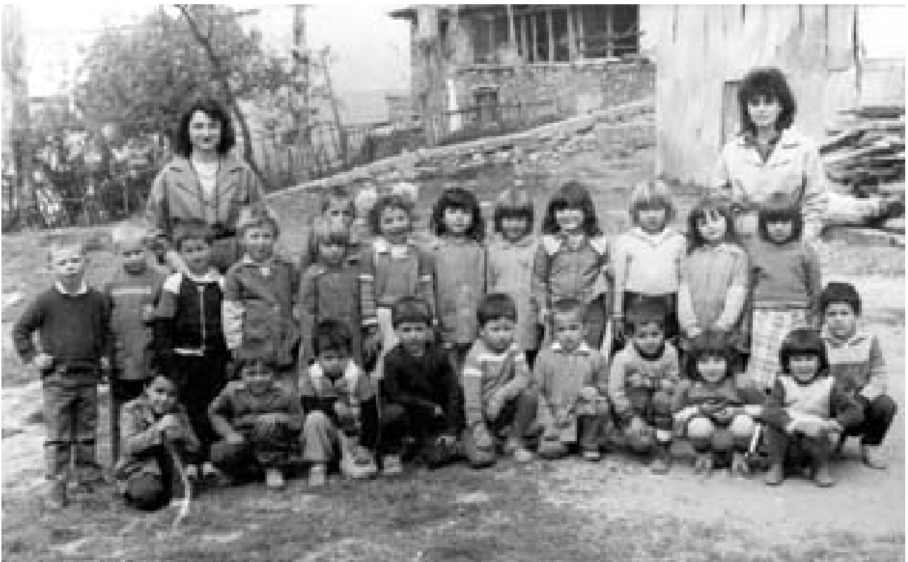
Дебрен, 90-те години на XX век

биографията на Мохамед и я използвайте в дискусиите.