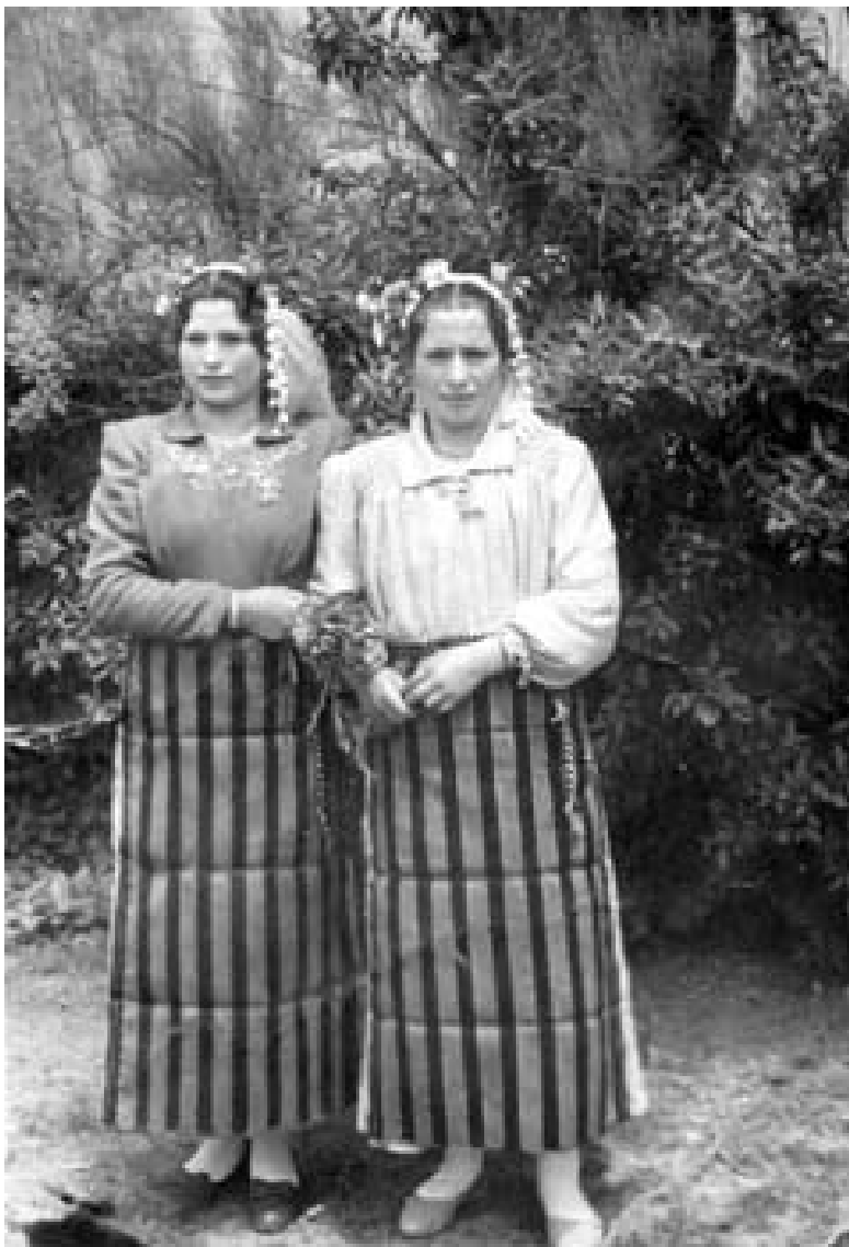
Момички от Якоруда, 60-те години на XX век