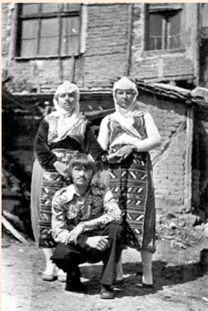
Буково, 60-те години на XX век